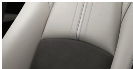
עור לבן Pure White בשילוב סווייד אפור ברמת גימור Pure White